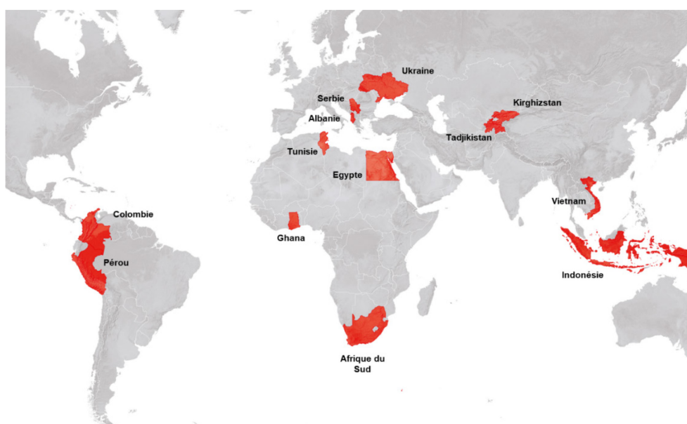
Figure 2: Pays prioritaires de la coopération économique au développement du SECO

Le SECO déploie, sur la base de ses compétences, des mesures complémentaires hors de ses pays prioritaires afin d'aborder de manière ponctuelle et flexible des défis spécifiques, par exemple dans le domaine de la migration. Les actions bilatérales du SECO sont complétées par des mesures globales qui contribuent à la maîtrise des défis mondiaux dans les domaines liés à la finance et au commerce, au climat et à l'environnement, à la migration et à l'eau.